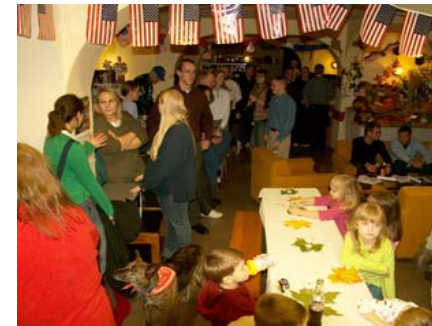
It's time to feed the kids!