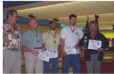
1st place; Graf 1!!!