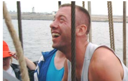
You could have skinny-dipped!