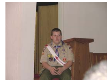
Getting the badges was easier!