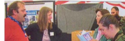
KONTAKT? That's us!