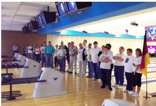
When do we start bowling?