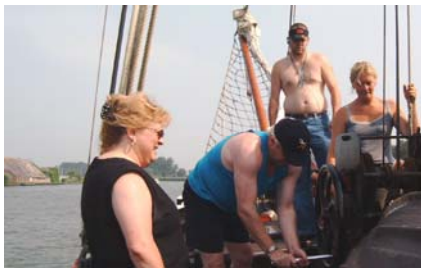
Someone has to do the work!